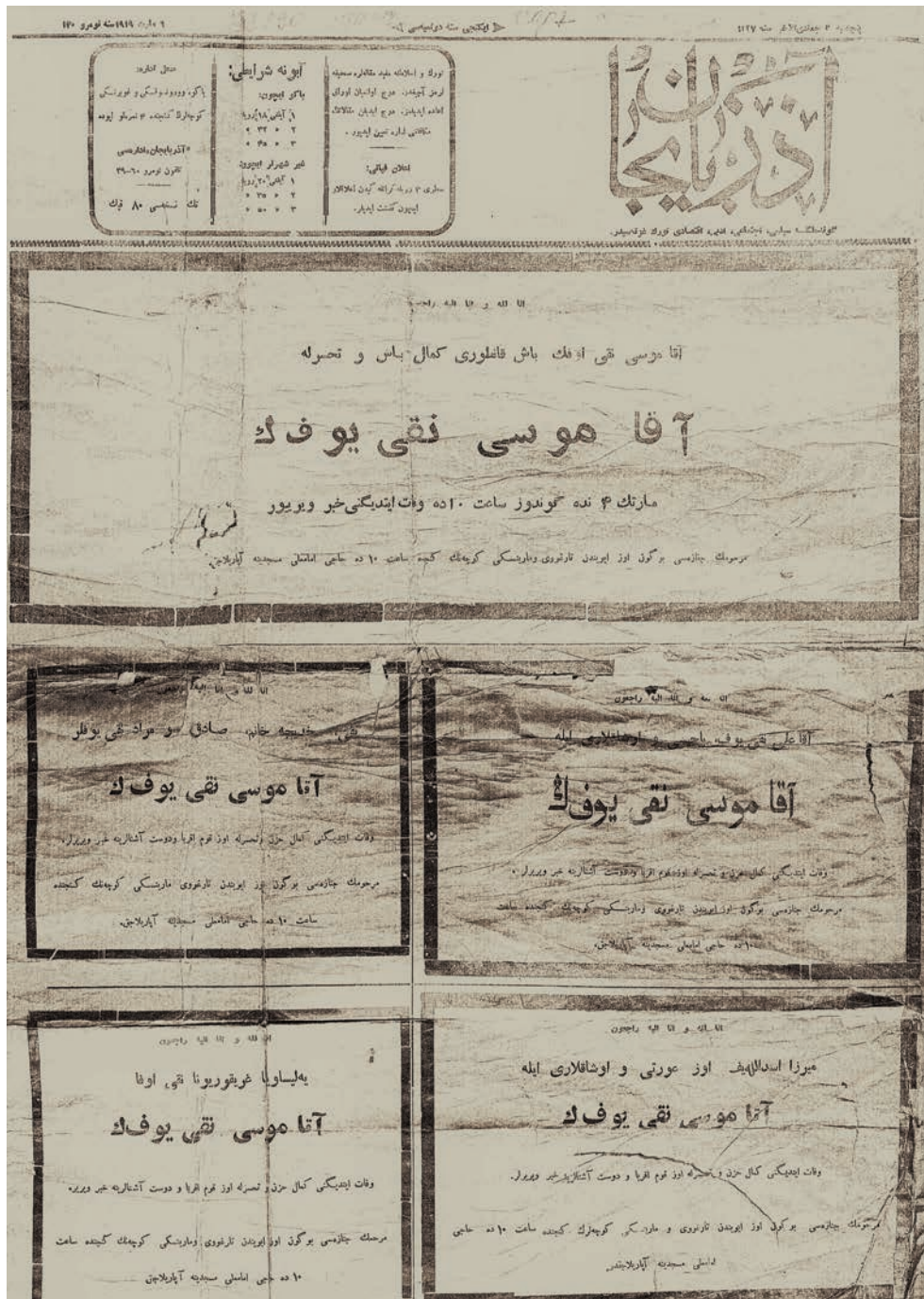
“Azərbaycan” qəzetinin 130-cu nömrəsinin 1-ci səhifəsi

Cümə axşamı, 6 mart 1919-cu il, nömrə 130