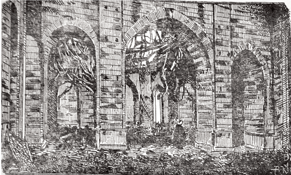
Şamaxıda kain tarixi məscidi-camenin yanğından sonra daxili mənzəri

həp iki şeydən nəşət etmişdir [irəli gəlmişdir]: