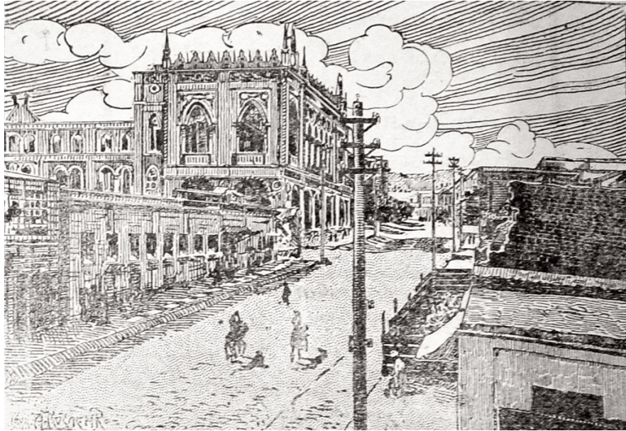
Yanğından sonra “İsmailiyyə” imarəti, “Açıq söz” və “Kaspi” qəzetələrinin mənzərələri