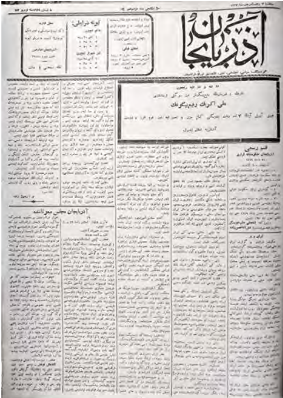
“Azərbaycan” qəzetinin 152-ci nömrəsinin 1-ci səhifəsi

Çərşənbə axşamı, 8 aprel 1919-cu il, nömrə 152