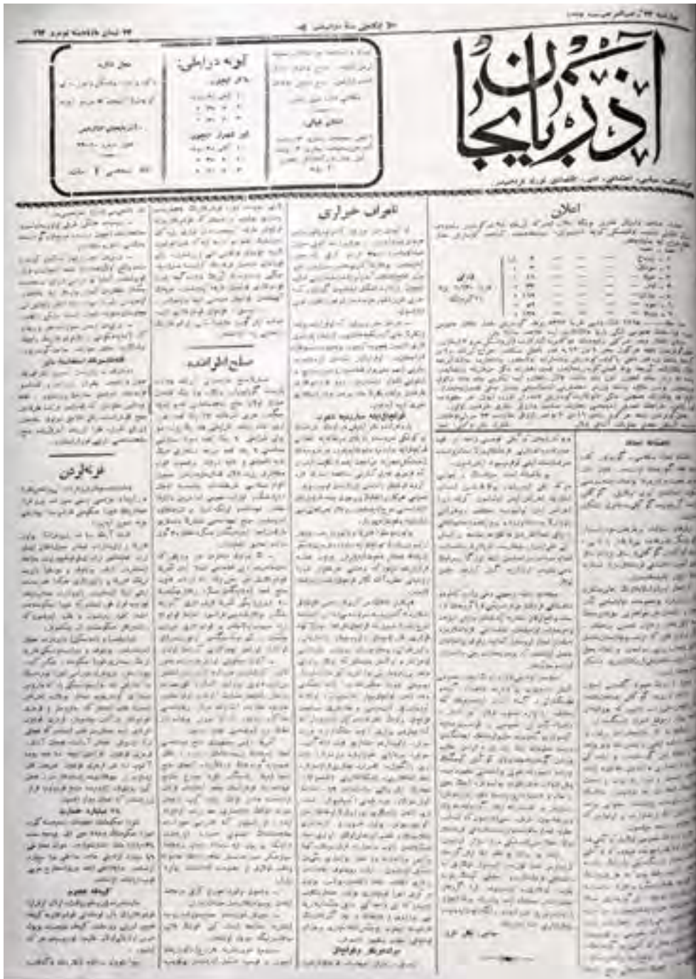
“Azərbaycan” qəzetinin 164-cü nömrəsinin 1-ci səhifəsi