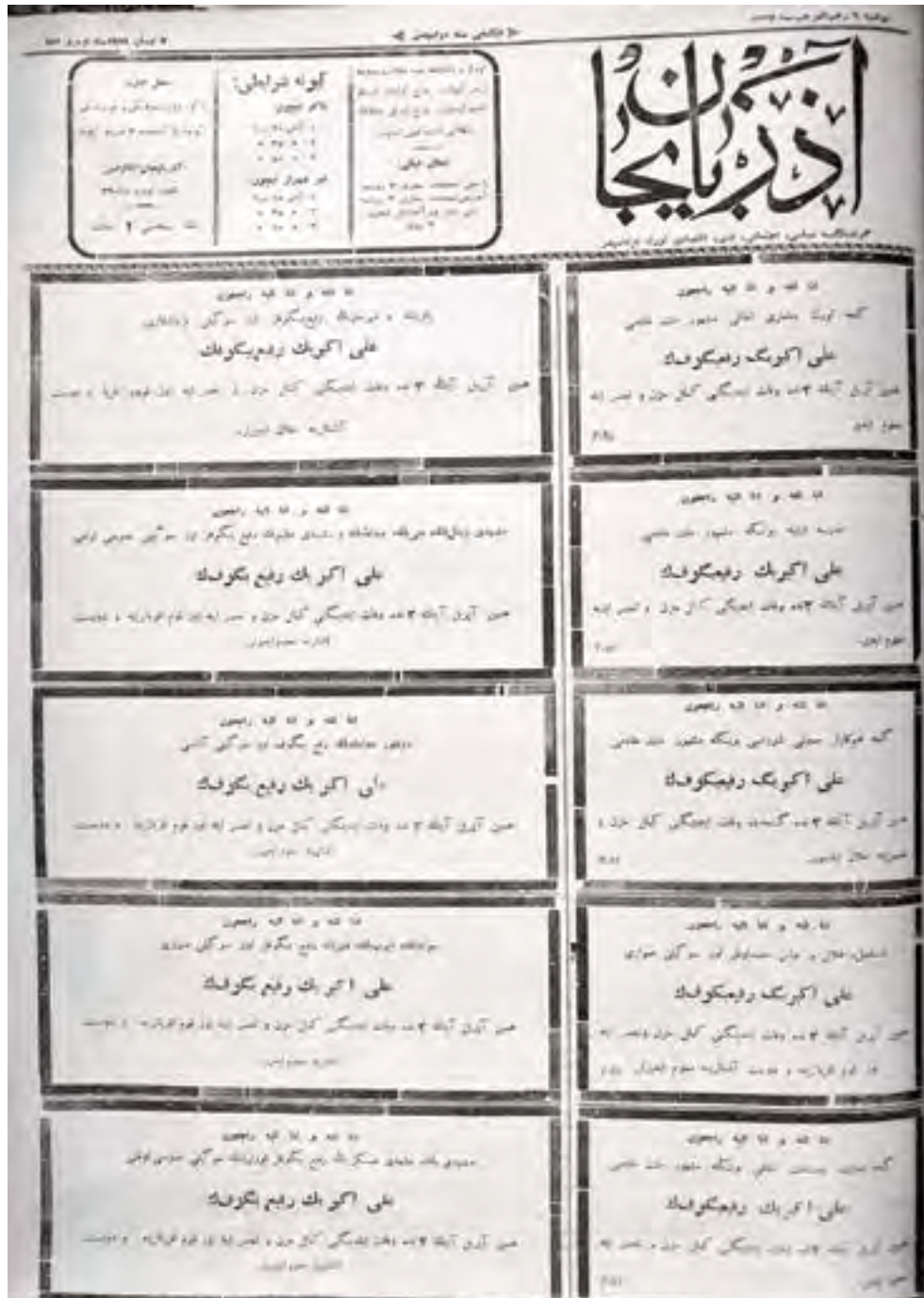
“Azərbaycan” qəzetinin 151-ci nömrəsinin 1-ci səhifəsi

Bazar ertəsi, 7 aprel 1919-cu il, nömrə 151