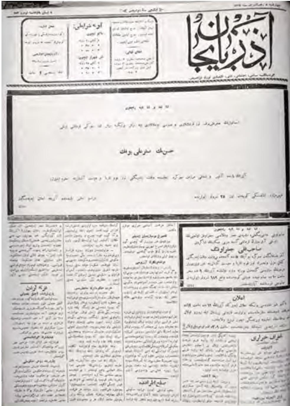
“Azərbaycan” qəzetinin 153-cü nömrəsinin 1-ci səhifəsi

Çərşənbə , 9 aprel 1919-cu il, nömrə 153