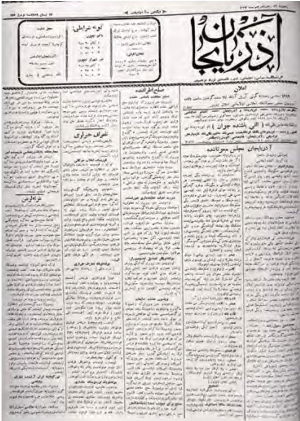
“Azərbaycan” qəzetinin 159-cu nömrəsinin 1-ci səhifəsi