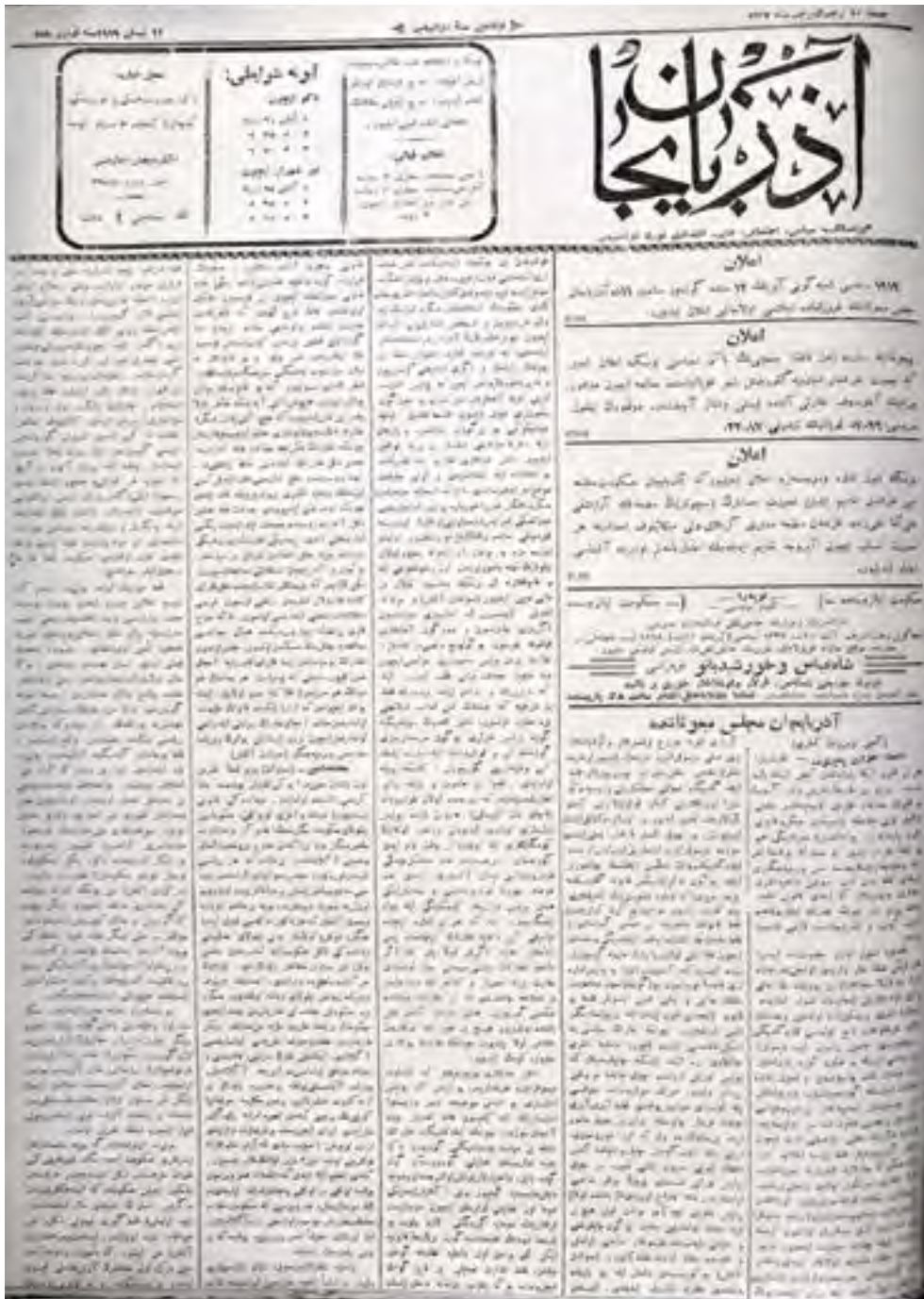
“Azərbaycan” qəzetinin 155-ci nömrəsinin 1-ci səhifəsi