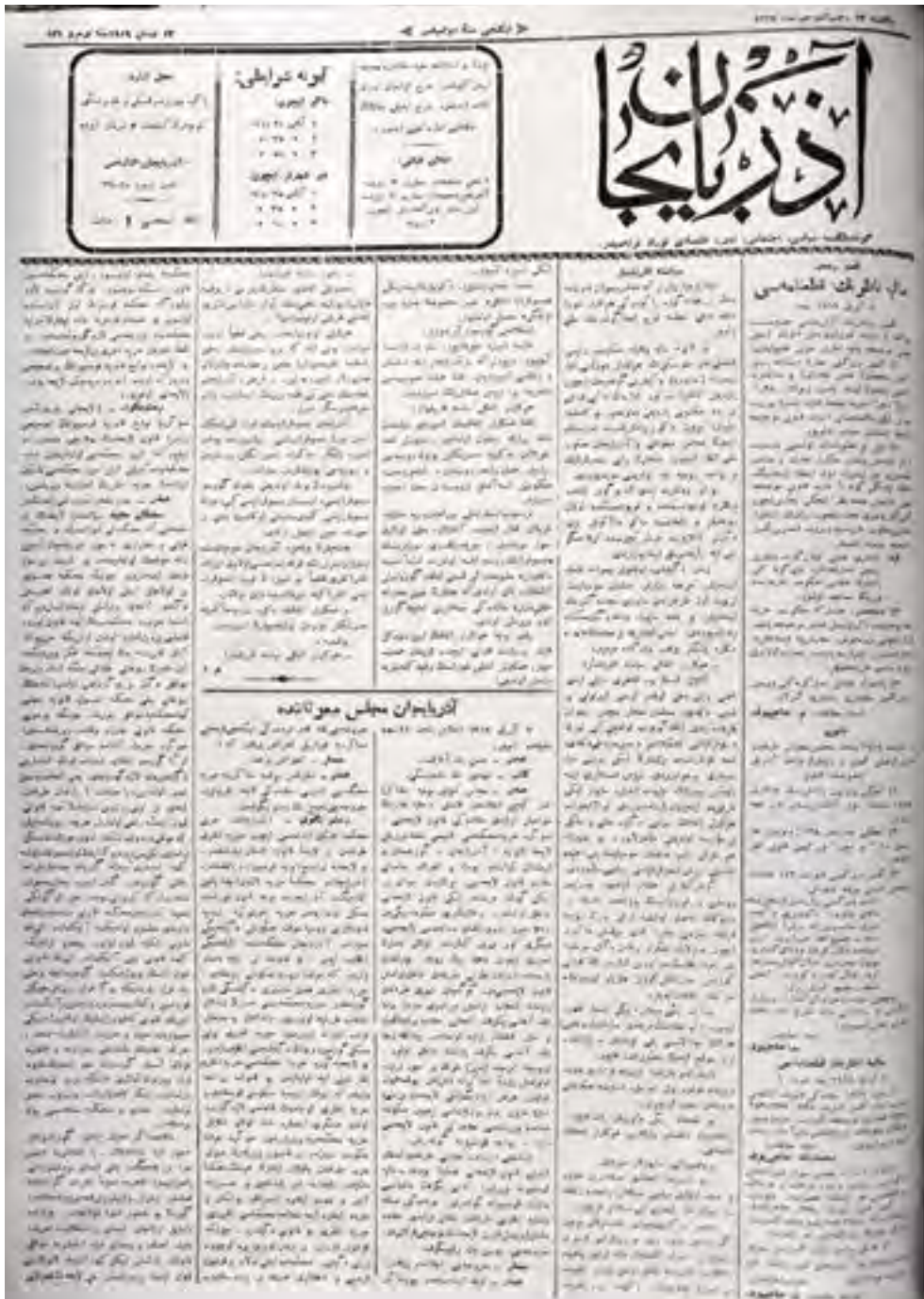
“Azərbaycan” qəzetinin 156-cı nömrəsinin 1-ci səhifəsi