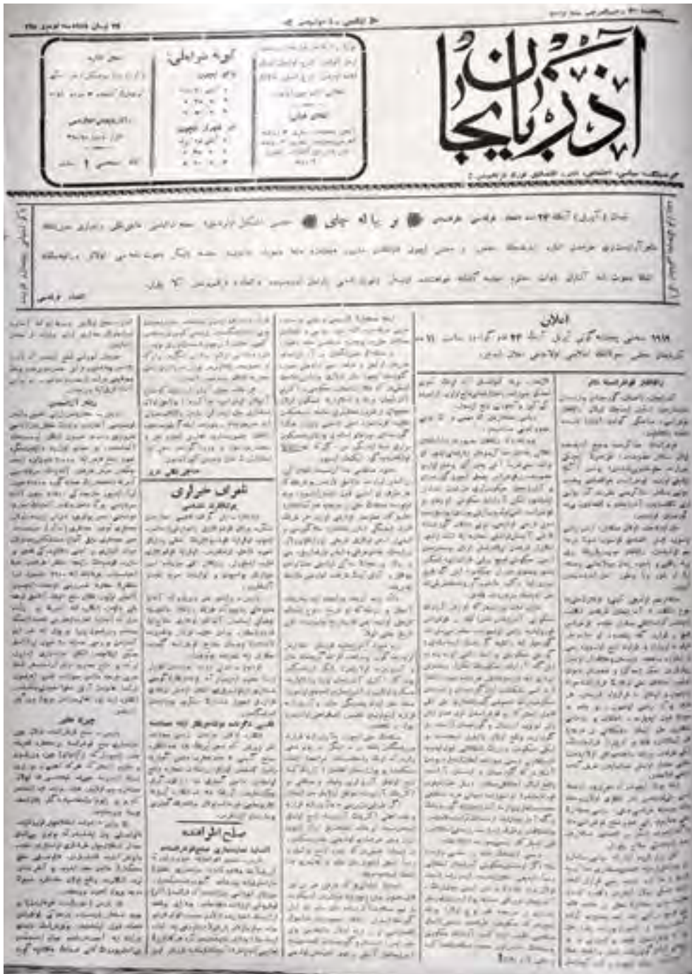
“Azərbaycan” qəzetinin 165-ci nömrəsinin 1-ci səhifəsi

Cümə axşamı, 24 aprel 1919-cu il, nömrə 165